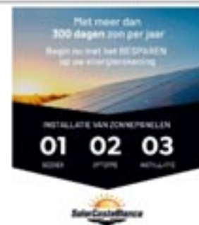
SolarCostaBianca Vraag een vrijblijvende offerte aan 611 71 74 36 www.solarcostablanca.com

Voor leden van de club los Holandeses geven wij op vertoon van een geldige lidmaatschapskaart, 20% korting op glazen, monturen en zonnebrillen (Niet geldig bij aanbiedingen en afgeprijsde artikelen).