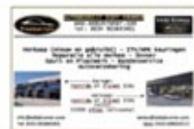
Autobedrijf Eddy Kramer

Dit willen wij doen om jullie tegemoet te komen en de leden van de 5005 een voordeel te bieden bij het afsluiten van een nieuwe verzekering.