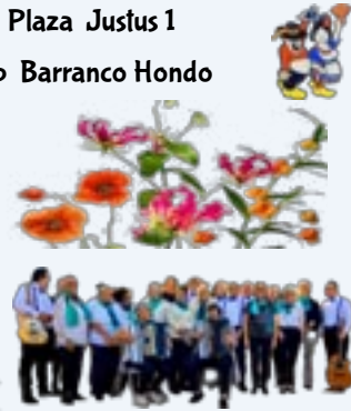
Met optreden van het El Canto de La Vida koor

HET BAR TEAM Staat klaar om je met een drankje en heerlijke hapjes te verwennen