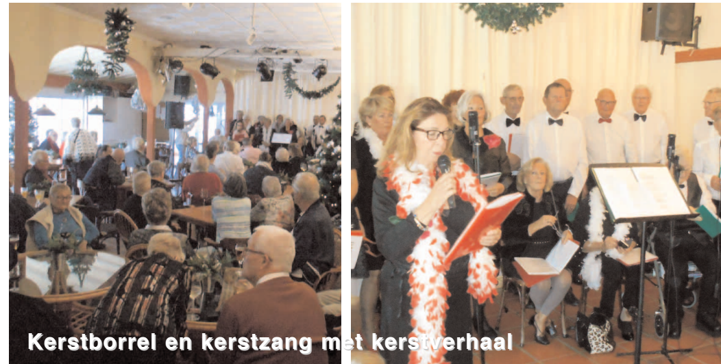
Kerstborrel en kerstzang met kerstverhaal