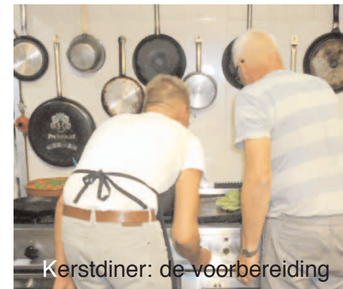
Kerstdiner: de voorbereiding