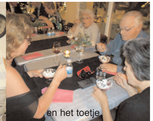
en het toetje