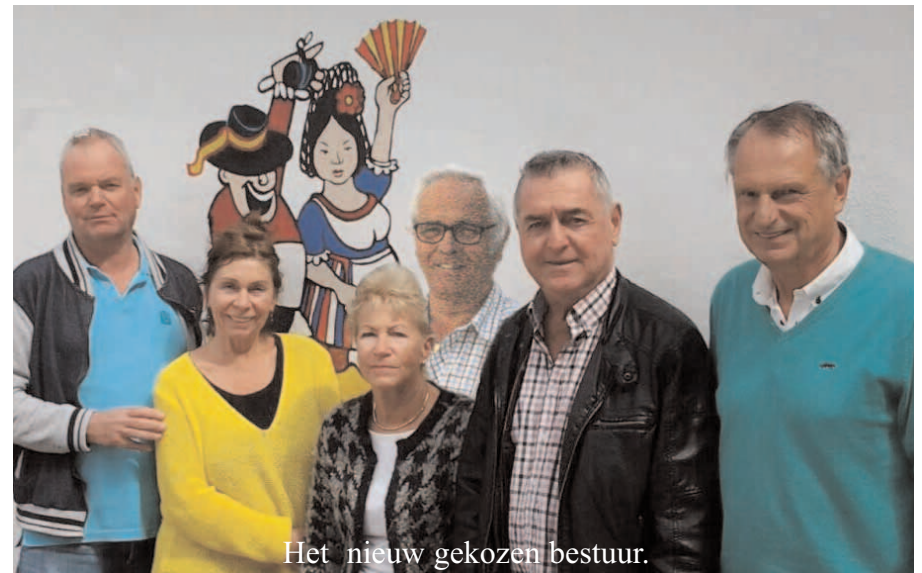
Het nieuw gekozen bestuur.