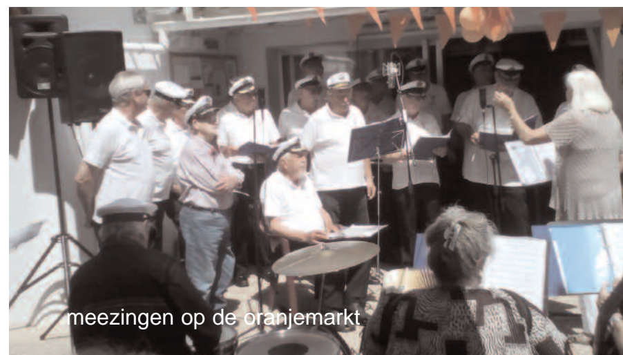
meezingen op de oranjemarkt