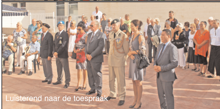
Luisterend naar de toespraak