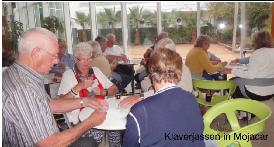
Klaverjassen in Mojacar