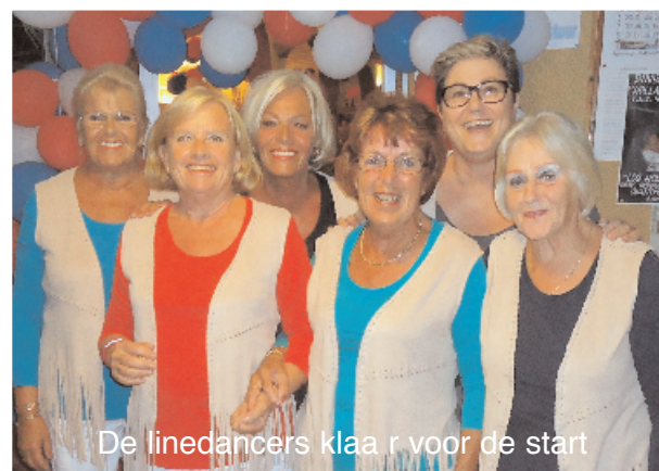
De linedancers klaar voor de start