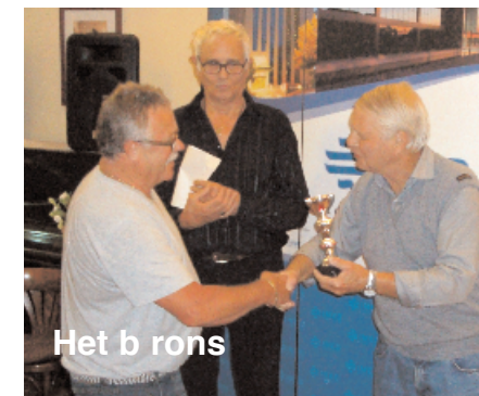
Het b rons