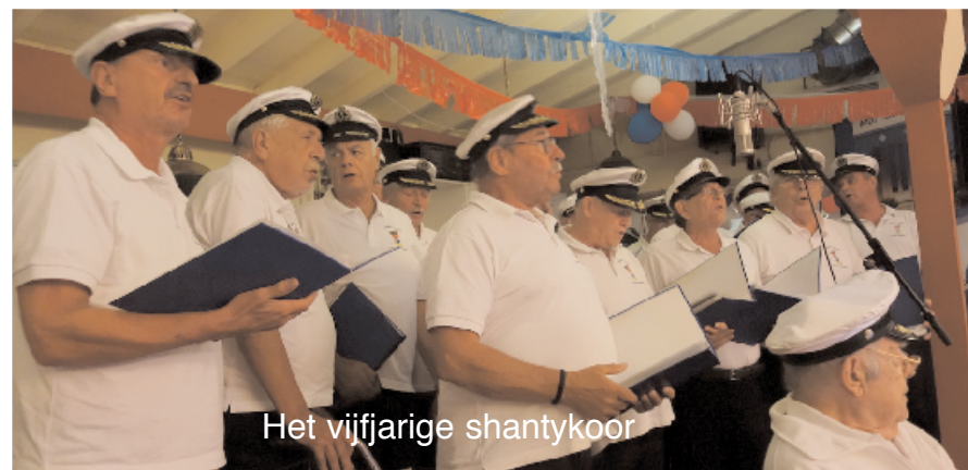
Het vijfjarige shantykoor