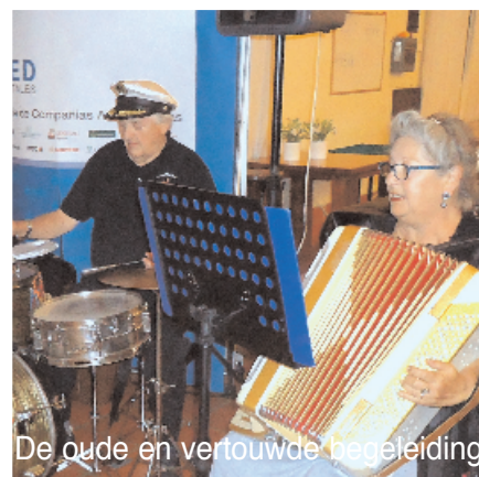
De oude en vertrouwde begeleiding