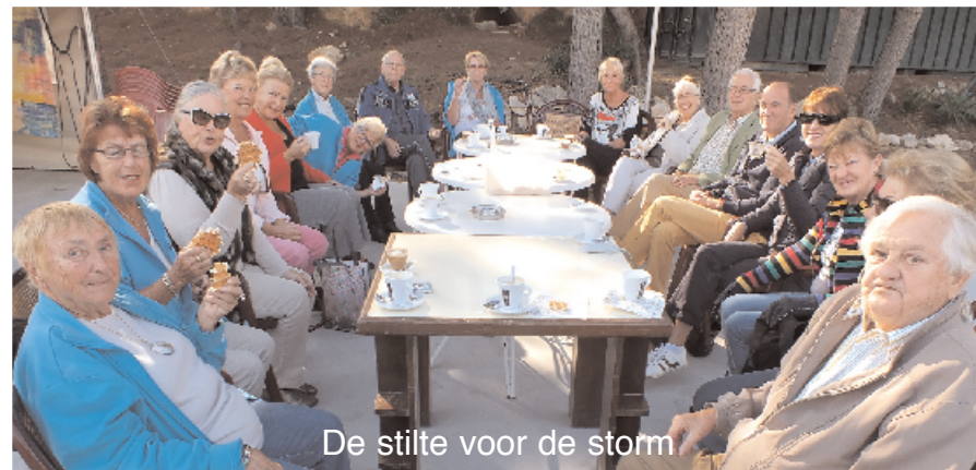
De stilte voor de storm