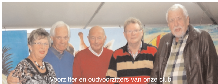
Voorzitter en oudvoorzitters van onze club