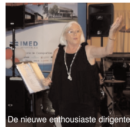
De nieuwe enthousiaste dirigente